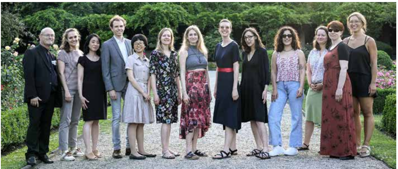
Canto Rubato ist ein Vokalensemble aus Berlin und iam 21. Juni auf der Bühne des Nachbarschaftstreff „OASE“ zu sehen.

Die Besucher*innen dürfen sich auf einen abwechslungsreichen Sommertag mit Musik, Begegnungen und vielen unterschiedlichen Angeboten für jedes Alter freuen. • F. Kuri