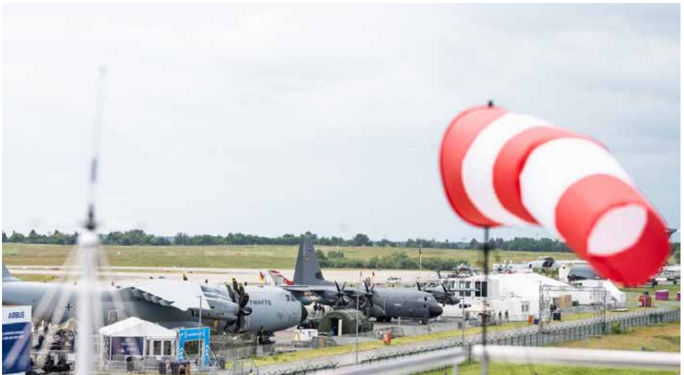
Unter dem Motto „Pioneering Aerospace“ öffnet die Internationale Luft- und Raumfahrtausstellung ihre Türen.

Bereits ab Montag, dem 08. Juni 2026, kann es rund um den BER vereinzelt zu einem erhöhten Flugaufkommen und einer lauterer Geräuschkulisse kommen. Grund dafür sind notwendige Trainings, Probe und Überführungsflüge für das Flugprogramm der ILA. Die Flüge finden ausschließlich in festgelegten Zeitfenstern und in enger Abstimmung mit den zuständigen Behörden statt. Die Veranstalter betonen, die Belastungen für Anwohnerinnen und Anwohner möglichst gering halten zu wollen und bitten bereits im Vorfeld um Verständnis. • jm / PM Messe Berlin GmbH