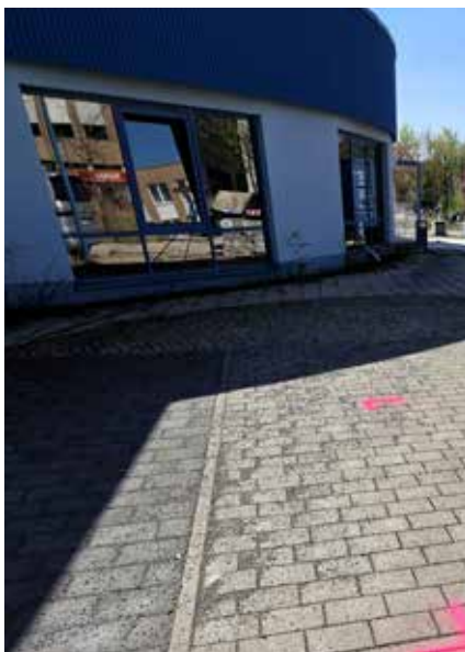
Die Abstimmungen mit dem Fernwärme-Anbieter sind erfolgt, Markierungen hierzu wurden auf der Baustelle vorgenommen.

Mit einer Fertigstellung ist nun zum Ende des Jahres 2026 zu rechnen. Die Inbetriebnahme soll rechtzeitig zum Beginn des zweiten Schulhalbjahres 2026/27 erfolgen, damit der Schulschwimmbetrieb aufgenommen werden kann.