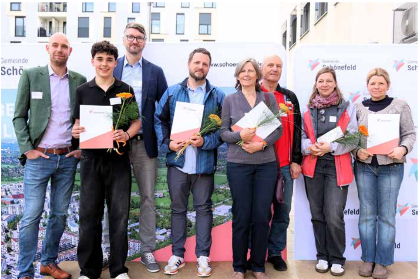
Die Preisträger*innen des Stadtradelns 2025