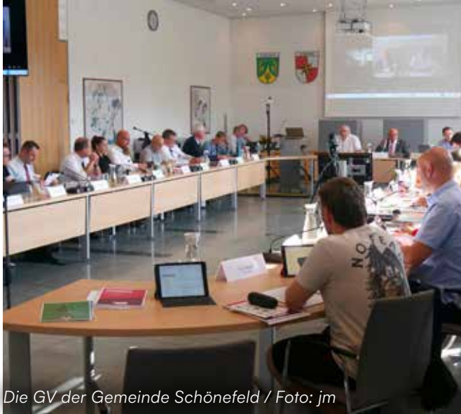
Die GV der Gemeinde Schönefeld