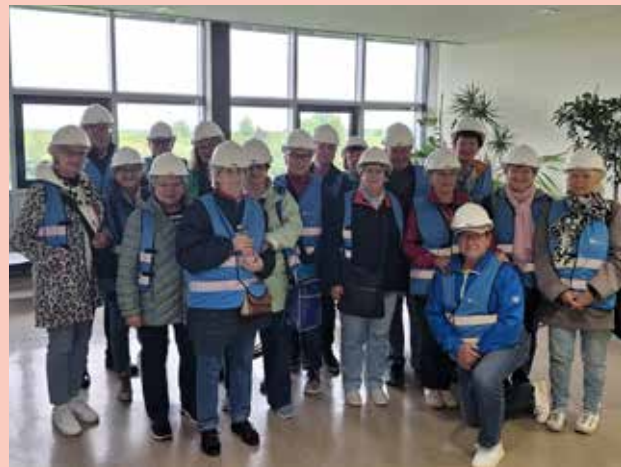
Schönefelder Senior*innen zu Besuch im Klärwerk Waßmannsdorf im Mai 2026 / Foto: S. Kammer

09.07.2026, 14:00 Uhr: „1. Hilfe-Kurs 60+“ Rathaus Gemeinde Schönefeld, Hans-Grade-Saal