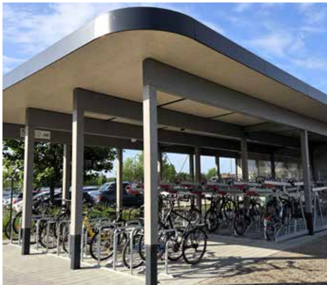
Fahrradparkhaus in Waßmannsdorf / Foto: Gemeinde Schönefeld.

Da die Schüler*innen der Interkommunalen Grundschule Schönefeld-Schulzendorf bislang noch übergangsweise in einer Sporthalle untergebracht sind, entsteht in Waltersdorf an der Diepenseer Straße eine Interimsschule. Ab August 2026 werden sie dann dort unterrichtet, bis die eigentliche dreizügige Grundschule 2028 in Schulzendorf steht. Mit dem neuen Standort entsteht ein moderner, kindgerechter Lernort, der den Schulalltag deutlich verbessern wird.