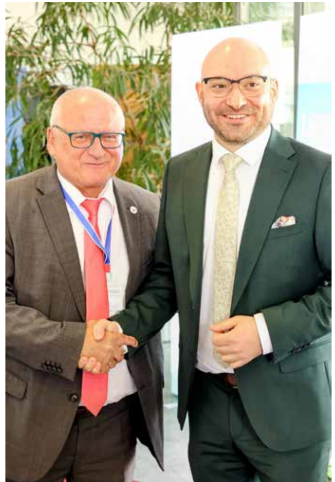
Besuch aus Potsdam in Schönefeld: René Wilke, Minister für Arbeit, Soziales, Gesundheit und gesellschaftlichen Zusammenhalt

Auch 2026 findet die Stadtradeln-Aktion wieder in der Gemeinde Schönefeld statt, diesmal vom 29.08. bis zum 18.09. Ab sofort ist es möglich, sich unter www.stadtradeln.de/schoenefeld oder in der Stadtradeln-App zu registrieren.