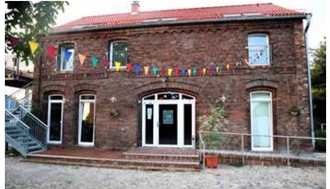
Neuer Veranstaltungsort der Fête de la Musique : Das Jaartn