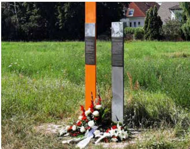
2026 jährt sich der Bau der Berliner Mauer zum 65. Mal.

Die Gedenkveranstaltung soll am 13. August 2026 zwischen 17:00 und 19:00 Uhr auf dem Sky Point in Großziethen