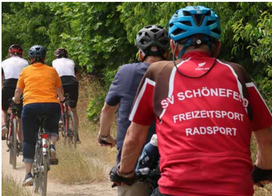
Mit der Radsportgruppe des SV Schönefeld Freizeitsport auf Tour

• Radsportgruppe SV Schönefeld Freizeitsport