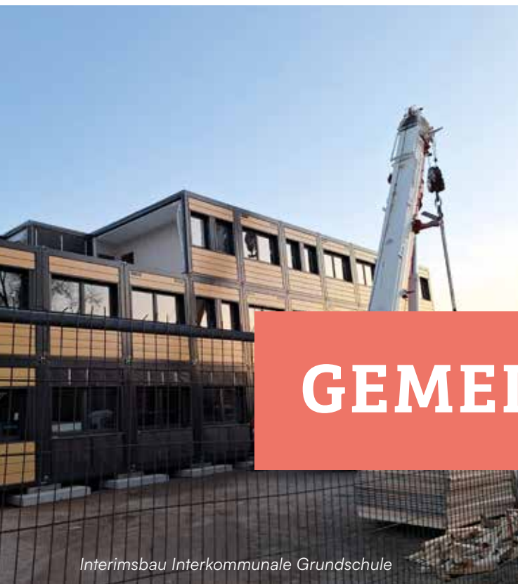
Interimsbau Interkommunale Grundschule