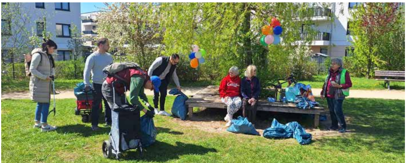
Für ein schöneres Schönefeld und der Umwelt zuliebe: Kehrtag im Ortsteil Schönefeld