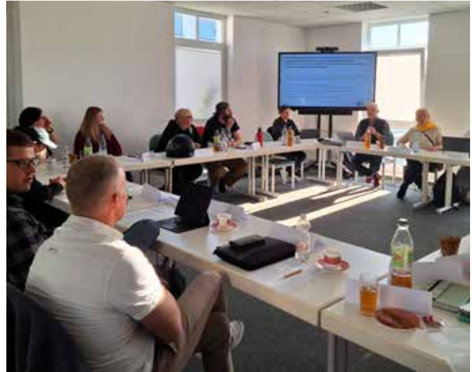
Auf der Klausurtagung entstanden viele Ideen, wie demokratische Beteiligung im Alltag erlebbarer werden kann.

Die Tagung machte deutlich, dass es in Schönefeld viele Menschen mit Ideen und Engagement gibt. Und genau daraus lebt Demokratie – vom Mitmachen und Austauschen. • F. Kuri