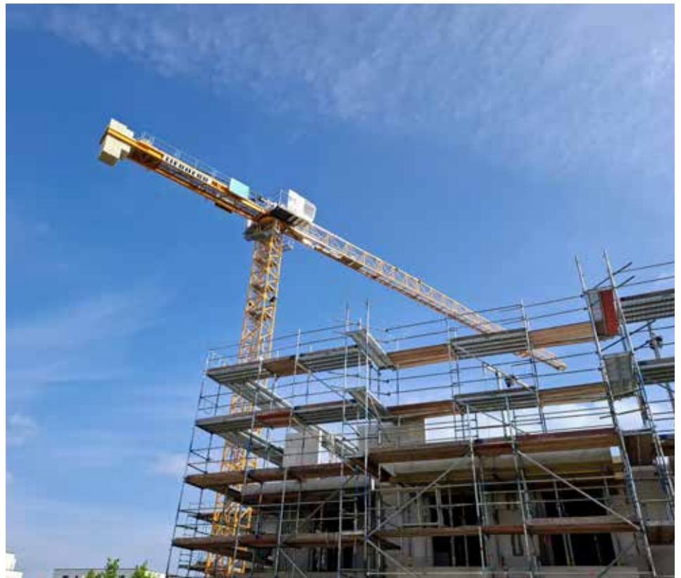
Bautätigkeit am Bayangol-Park im Ortsteil Schönefeld

Trotz der neuen Erleichterungen bleiben die grundlegenden Prinzipien der Bauleitplanung bestehen. Auch fachrechtliche Vorgaben etwa im Natur-, Immissions- oder Denkmalschutz sind weiterhin einzuhalten. Zentrale formelle Voraussetzung ist die Zustimmung der