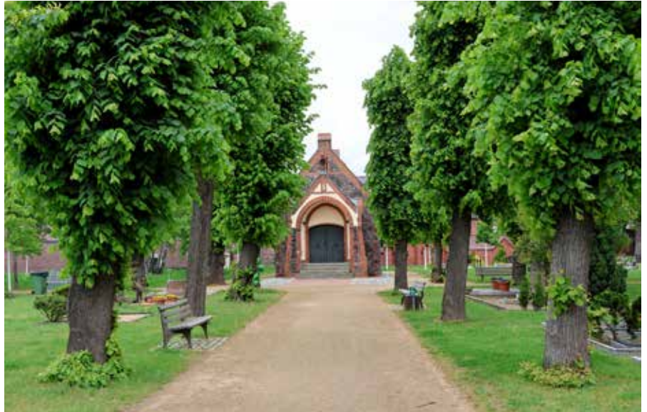
Der Friedhof in der Schönefelder Kirchstraße

Die Verwaltung und Beaufsichtigung der Friedhöfe sowie der Trauerhallen liegt in der Verantwortung der Gemeinde Schönefeld. Grundlage hierfür sind die Friedhofssatzung und die Friedhofsgebührensatzung, die zentrale Regelungen zum Zweck der Friedhöfe als öffentliche Einrichtungen, zur Nutzung und zum Verhalten auf den Anlagen, zu Bestattungsvorschriften, Grabarten und Nutzungsrechten sowie zur Gestaltung und Pflege der Grabstätten enthalten. Diese sind auf der Homepage der Gemeinde Schönefeld einsehbar.