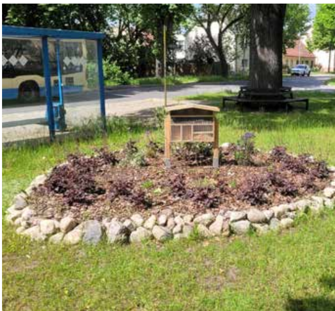
Der Dorfplatz in Selchow

Ribbecke: Der Flughafenbau hat Selchow stark verändert.