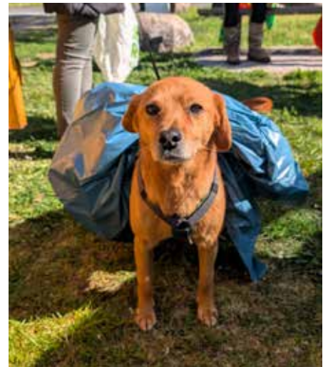
Rege Beteiligung beim diesjährigen Kehrtag in Waßmannsdorf. Wie man sieht, wurde die Aktion auch von Vierbeinern unterstützt.