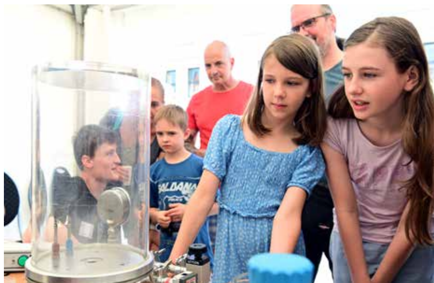
Innovationsmeile: Jährliches Wissenschafts- und Technikfestival für die ganze Familie

• Wirtschaftsförderungsgesellschaft Dahme-Spreewald mbH