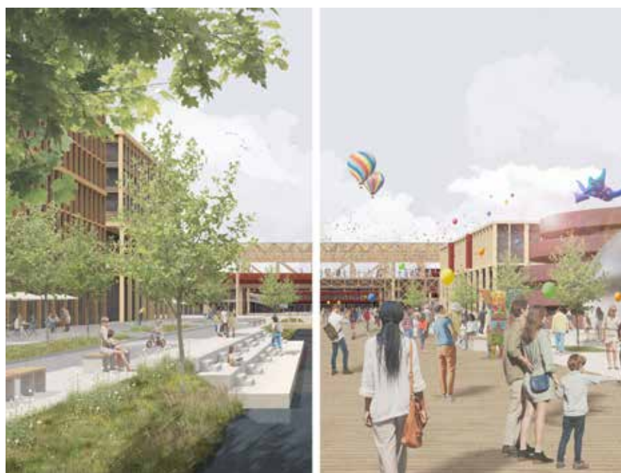
Teile des Expo-Geländes in der Visualisierung / Grafik: gmp / Expo 2035 Berlin