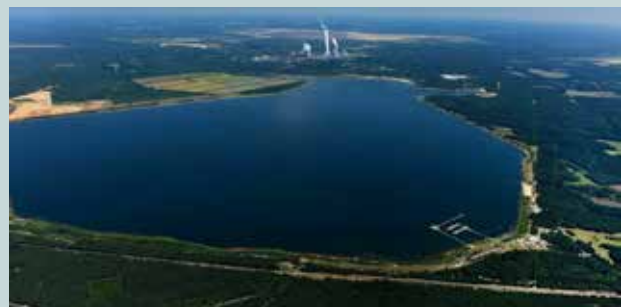
Der Bärwalder See im Lausitzer Seenland

Renate Dalkowski 03379 44 42 52 oder Manuela Kraft 0174 49 18 743