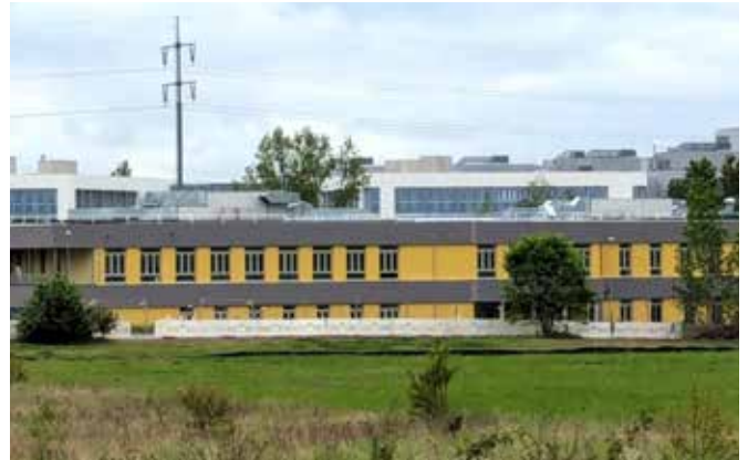
Am Neubau der Kita Holzworm in der Pestalozzistraße wurde das Baugerüst entfernt.