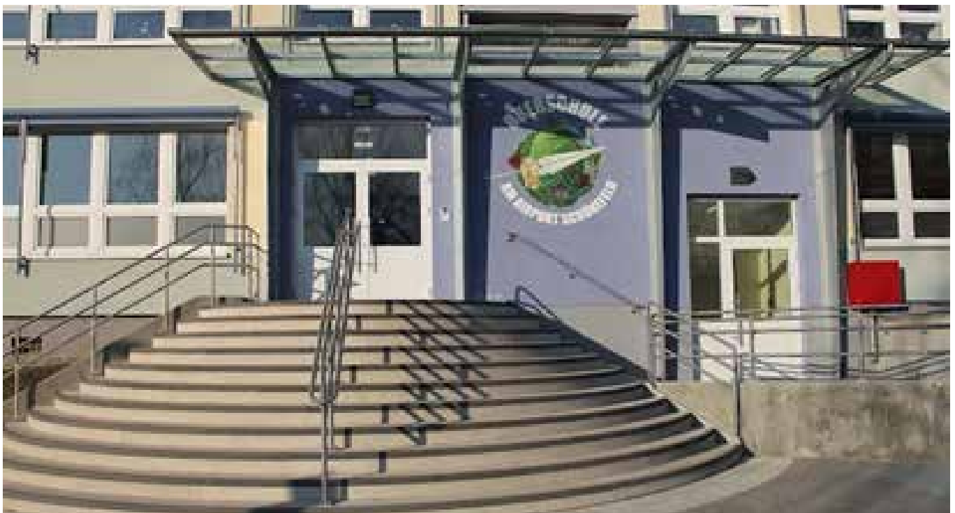
Die Oberschule am Airport: Ort für gemeinsames Lernen und besondere Erlebnisse

• Text und Foto: Frau Rahn, Öffentlichkeitsarbeit Oberschule am Airport Schönefeld