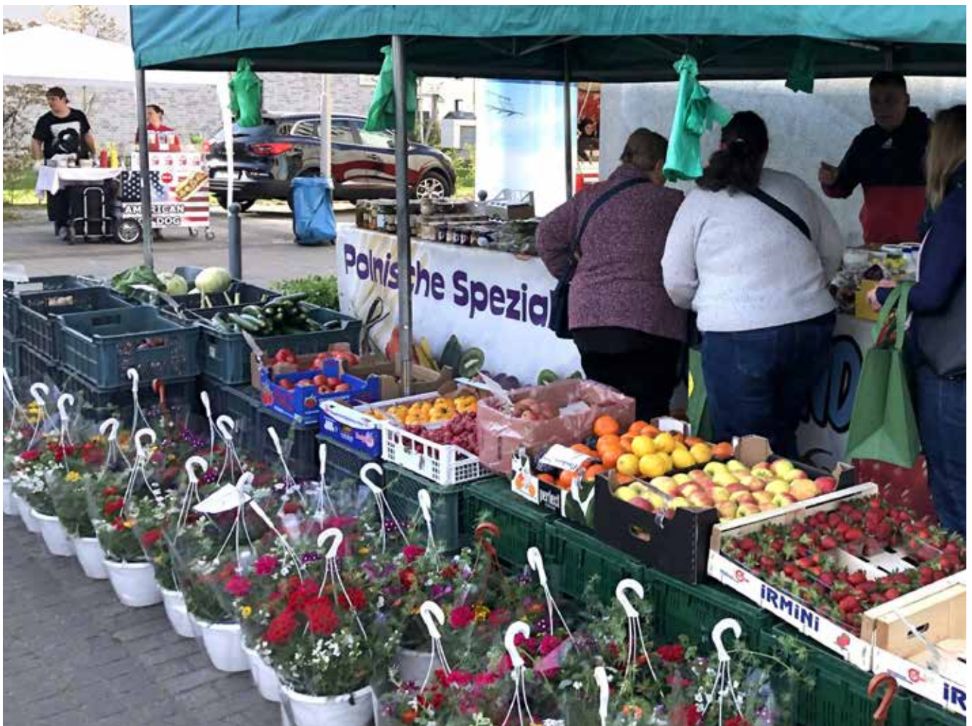
Zum Auftakt am 18. April stieß der Schönefelder Wochenmarkt auf positive Resonanz.

Interessierte Händlerinnen und Händler sind weiterhin herzlich willkommen. Sie können sich bei Frau Lindner von der Deutschen Marktgilde per E-Mail unter k.lindner@marktgilde.de oder bei Herrn Dieter telefonisch unter 0160 99 07 58 54 melden. • jm