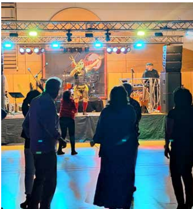
Tanz in den Mai

In der letzten Sitzung des Ortsbeirats am 5. Mai 2026 wurde die Problematik zwischen E-Scooter-Fahrern und Fußgängern thematisiert. Häufig benutzen E-Scooter-Fahrer auch die Bürgersteige und unterschätzen dabei die Geschwindigkeit, mit der sie auf den oftmals sehr schmalen Gehwegen unterwegs sind. Diese Wege erlauben kaum Begegnungsverkehr oder ein Nebeneinandergehen, wodurch es immer wieder zu Konflikten kommt. Um diese zu vermeiden, sind mehr Rücksicht, das Fahren mit Schrittgeschwindigkeit auf dem Bürgersteig sowie genügend Abstand wünschenswert.