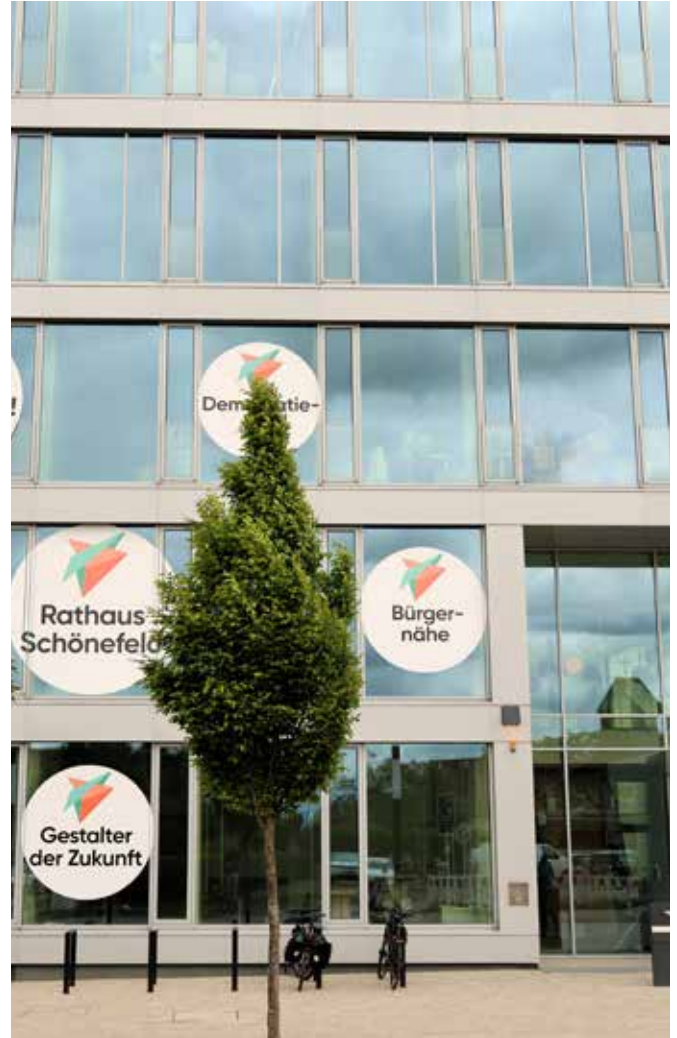
Vorderfront neues Rathaus Mittelstraße 3

Ab dem Zeitpunkt der jeweiligen Übernahme der vorbereiteten und hergerichteten Etagen entsteht schrittweise die Mietzahlung.