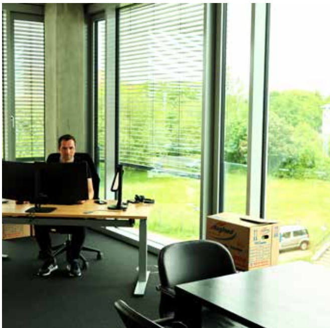
Das Dezernat IV nimmt seine Arbeit am neuen Standort auf.

Für die Umzüge wurde bereits eine feste Reihenfolge abgestimmt, die aus organisatorischen Gründen eingehalten werden muss. Bereits umgezogen ist das Dezernat IV, um die bisherigen Liegenschaften in Waltersdorf freizumachen. Diese sollen anschließend auf den Markt gebracht und vermietet werden. Danach soll das Dezernat III folgen, anschließend das Dezernat II und Ende Juli/Anfang August das Dezernat I. Der Bürgermeisterstab und der Bereich Personal und Recht werden voraussichtlich zuletzt umziehen.