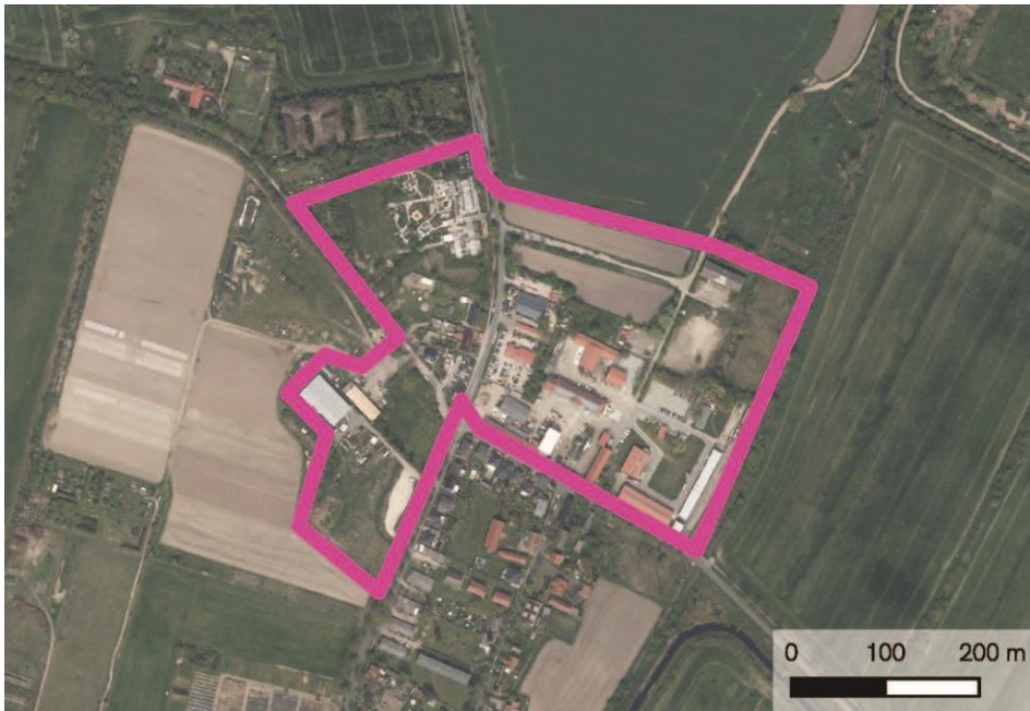
Satellitenbild mit Abgrenzung