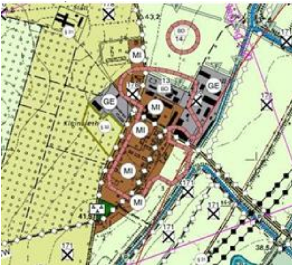
Ausschnitt FNP (aktuelle Arbeitskarte Stand 09/2021)